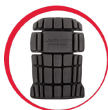
Ochraniacze kolan do spodni/ogrodniczek ochronnych

MATERIAŁ: 60% bawełna, 40% poliester, 270 g/m 2 . Pasy odbłaskowe zgodne z normą EN ISO 20471. Wysoka klasa widzialności: klasa 2. Podwójne szwy. Regulacja w pasie za pomocą ściągacza. Szlufki na pasek. Nap pokryty tworzywem chroniącym przed kontaktem z wodą. 10 kieszeni, w tym 4 zapinane na rzep. Kieszenie na ochraniacze kolan zamykane na rzep. Szlufka na młotek. Wszywka identyfikacyjna. NORMA: EN ISO 13688, EN ISO 20471.