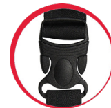
Specjalna konstrukcja klamry zapobiegająca jej zsuwaniu się