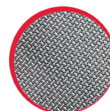
Wzmocnienia materiałem odpornym na przetarcia