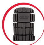
Ochraniacze kolan do spodni/ogrodniczek ochronnych