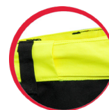
Innowacyjna regulacja szerokości w pasie