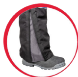
Regulacja szerokości nogawek

MATERIAŁ: Powłoka: 100% poliester pongee 275 g/m 2 . Ocieplina: 160 g/m 2 . Podeszewka: tafta 50 g/m 2 . Impregnowana tkanina typu rip-stop pokryta PVC, wytrzymała i odporna na uszkodzenia mechaniczne. 7 kieszeni, w tym 4 zamykane na rzep. Regulacja szerokości w pasie za pomocą gumki. Szlufki na pasek. Odblaskowe elementy. Regulacja szerokości nogawek u dołu za pomocą suwaka. NORMA: EN ISO 13688.