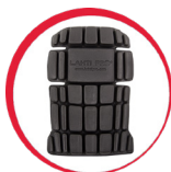
Ochraniacze kolan do spodni/ogrodniczek ochronnych

MATERIAŁ: Tkanina typu soft-shell 96% poliester, 4% elastan 280 g/m 2 . Specjalna 3-warstwowa tkanina soft-shell z membraną TPU, wodoodporna (8000 mm), oddychająca (3000 g/m 2 /24h), gwarantująca wysoki komfort użytkowania. 5 kieszeni zamykanych na suwak. Kieszenie na ochraniacze kolan wykonane z mocnego materiału typu poliester Oxford 300D. Regulacja szerokości w pasie za pomocą gumki. Szlufki na pasek. Regulacja szerokości nogawek u dołu za pomocą suwaka i rzepa. NORMA: EN ISO 13688.