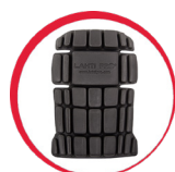
Ochraniacze kolan do spodni/ogrodniczek ochronnych

MATERIAŁ: 35% bawełna, 65% poliester. 5 kieszeni, w tym 2 zapinane na rzep. Podwójne szwy. Regulacja szerokości w pasie za pomocą gumki. Oczko na klucze. Szlufki na pasek. Kieszenie na ochraniacze kolan zapinane na rzep. Kontrastujące szwy podkreślające dokładność i precyzję wykończenia. Wszyskwa identyfikacyjna. NORMA: EN ISO 13688.