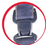
Specjalna konstrukcja klamry zapobiegająca jej zsuwaniu się

MATERIAŁ: 35% bawełna, 65% poliester. 6 kieszeni, w tym 1 zamykana na suwak. Podwójne szwy. Regulacja szerokości w pasie za pomocą guzików i gumki. Szelki z regulacją długości za pomocą zapięcia i gumki. Szlufka na młotek i miarkę. Kontrastujące szwy podkreślające dokładność i precyzję wykończenia. Wszywka identyfikacyjna. NORMA: EN ISO 13688.